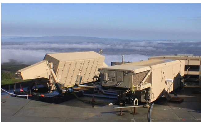
(左) 経ヶ岬に配備予定のXバンドレーダー

ところで、現代の戦争においてレーダーは決定的に重要な役割を果たします。ミサイルや戦闘機、空母や原子力潜水艦など、どんなに高価で優れた兵器でもレーダーの誘導なしにはその性能を十分に発揮することはできません。それゆえ戦争の際にはレーダーは真っ先に攻撃の対象となります。米軍Xバンドレーダー基地の建設は、丹後半島を東アジアでの戦争の最前線に変えるとともに、周辺住民を戦争の脅威を日々さらし続けることとなります。